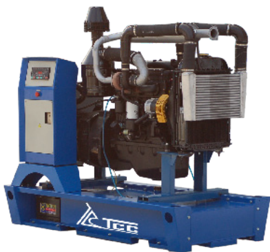
АД-60С-Т400-1РМ1 ДВИГАТЕЛЬ ММЗ Д-246.4