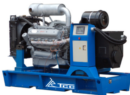
АД-200С-Т400-1РМ2 ДВИГАТЕЛЬ ЯМЗ-7514

Группа компаний ТСС разрабатывает и серийно выпускает дизельные электростанции ТСС серии «Славянка», укомплектованные надежными двигателями Минского (ММЗ) и Ярославского (ЯМЗ) моторных заводов. Сочетание надежности и ремонтно-пригодности двигателей с высоким качеством электроэнергии генераторов ведущего производителя— TSS-SA является оптимальным решением для автономного энергоснабжения потребителей.