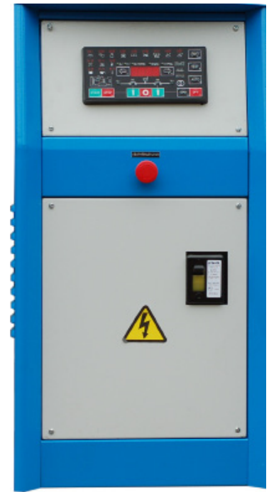
ЩУЭ (2-я степень автоматизации)