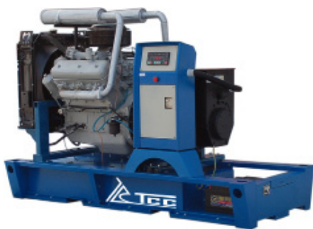
АД-60С-Т400-1РМ2 ДВИГАТЕЛЬ ММЗ Д-266.4