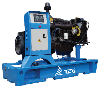
АД-30С-Т400-1РМ1 ДВИГАТЕЛЬ ММЗ Д-246.1