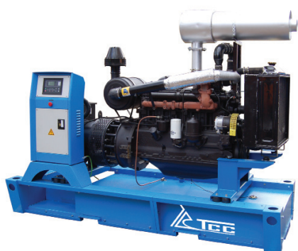
АД-100С-Т400-1РМ1 ДВИГАТЕЛЬ ММЗ Д-266.4